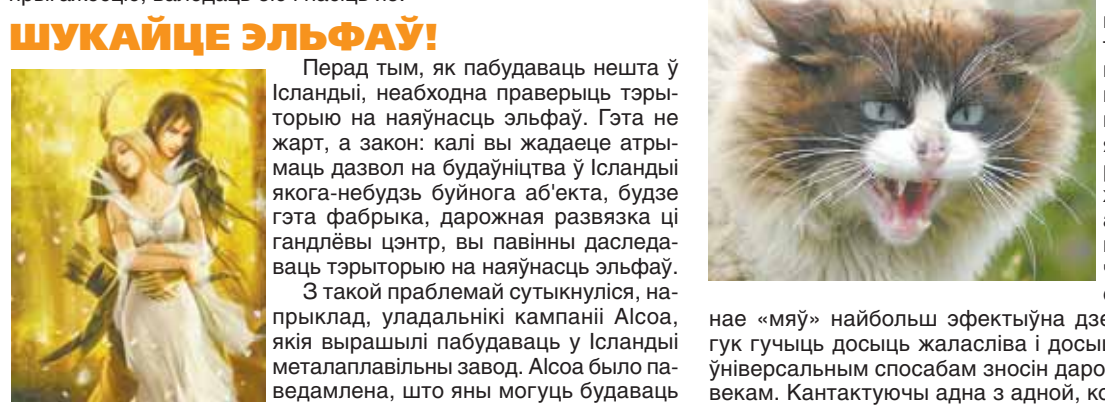
Усё, што заўгодна, на набывай імі зямлі, але толькі пасля таго, як урадавы эксперт даследуе тэрыторыю і выдаць заключэнне аб тым, што на ёй не жыве «таемны народзец». Гэта даволі дзіўна, але ў Ісландыі 54% насельніцтва не адмаўляе існавання эльфаў, 8% безумоўна верыць у іх, а 3% сцвярджае, што могуць бачыць іх або адчуваць іх прысутнасць! Калі пабудаваць фабрыку або іншы буйны аб’ект на зямлі, у якой жывуць элфы, міфічныя істоты нібыта част хвалюцца, што страчаюць розум і вар’яцуюць, што, у сваю чаргу, вядзе да самых жудасных наступстваў: катастроф, разбурэнняў, смерці людзей. Не асабліва важна, ці верыць у існаванне эльфаў урад Ісландыі, але, калі ў іх верыць народ, з гэтым нельга не лічыцца. Таму эксперты выдаюць заводам адпаведныя даведкі, і людзі ідуць працаваць на такія прадпрыемствы са спакойным сумленнем.

Перад тым, як пабудаваць нешта ў Ісландыі, неабходна праверыць тэрыторыю на наяўнасць эльфаў. Гэта не жарт, а закон: калі вы жадаеце атрымаць дазвол на будаўніцтва ў Ісландыі якога-небудзь буйнога аб’екта, будзе гэта фабрыка, дарожная развязка ці гандлёвы цэнтр, вы павінны даследаваць тэрыторыю на наяўнасць эльфаў. З такой праблемай суткнуліся, напрыклад, уладальнікі кампаніі Alcoa, якія вырашылі пабудаваць у Ісландыі металургічны завод. Alcoa было паведамлена, што яны могуць будаваць