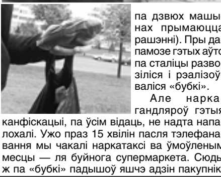
Фактычна даследаванні паказалі, што тавар з дзвюх першых пунктаў не падлягае дзяржаўным стандартам і прыдатны для прыгатавання наркатычнага раствора.

Закупка 3. НАРКАТАКСІ 17 верасня 2011 года пры дапамозе былога наркаспажыўцы Віктара звязваемся з так званым наркатаксістам. Цягам 2011 года, па паведамленнях ГУУС Мінгарвыканкама, у сталіцы канфіскавалі 14 наркатаксі (яшчэ