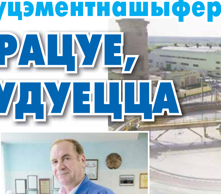
На дзеючай вытворчасці.

І гэта, увогуле, зразумела. Але, разам з