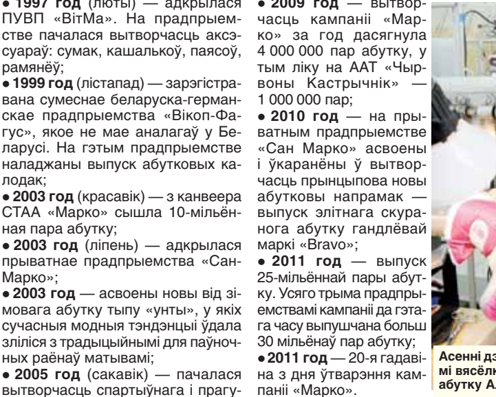
Асёні дзіцячы абутак упрыгожваю ўсімі фарбамі вясёлкі — гэта справа рук зборшчыцы верху абутку Алены АФАНАСЬЕВАЙ.

Сёння СТАА «Марко» — гэта перадавыя высокатэхналагічныя працэсы вытворчасці з прымяненнем сучаснага абсталявання і новых тэхналогій