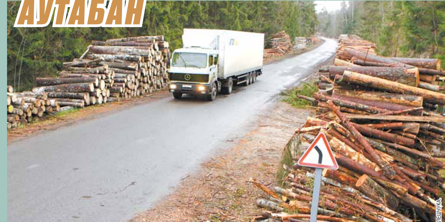
Велізарны дрывяны склад утварыўся абাপал аўтамагістралі Беразіно — Дзмітровічы — Барысаў пасля селетняга жывёнскага ўрагану. Дагэтуль побач з шашой ядуцца нарыхтоўчыя і пагрузчыя работы пашкоджана стыхійай лесу. Таму хуткасы рэжым і мануэраванне на гэтым напрамку яшчэ доўга будуць заставацца абмежаванымі.