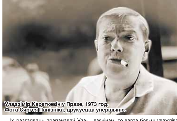
Уладзімір Караткевіч у Празе, 1973 год.

Аднойчы мне падарвалі кнігу. Такое калісьці здарэцца ў кожнага дзіцяці, калі бацькі вырашаюць, што хочыць ужо на Дзень народзінаў дарыць цацкі ды суенкі з кашулямі, а трэба нешта больш сур'ёзнае. У няпрсты час асабовага выпявання тата прынес кнігу і сказаў, што гэта мне падарунак ад бабулі. Кніга была тоўстая. Чытаньня дагэтуль дзіцячыя кніжкі адразу падаліся нейкімі несур'ёзнымі. Мо з-за адчування важкай сур'ёзнасці я адразу за яе ўзялася і літаральна «праглынула». З той самай першай кнігі, атрыманай на дзень народзінаў ад бабулі, мяне нікому не даводзілася пераканаць, што кніга — лепшы падарунак. Гэта быў раман «Каласы пад сярпом тваім».