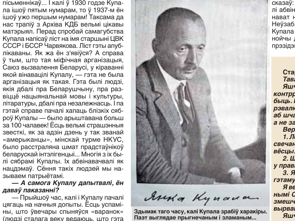
Здымак таго часу, калі Купала зрабіў харакіры. Пэат выказаў прыгнечаны і зламаны...

ПЕРАДСМЯРОТНЫ ЛІСТ КУПАЛЫ Старшыні ЦВК СССР і БССР т. Чарвякову. Таварыш старшыня! Яшчэ раз перад смерцю заяўляю, што я ў ніякай контррэвалюцыйнай арганізацыі не быў і не збіраўся быць. Ніколі не быў контррэвалюцыянерам і да контррэвалюцыі не імкнуўся. Быў толькі паэтам, які думаў аб шчасці Беларусі. Я ўміраю за Савецкую Беларусь, а не за якую іншую. Верш мой справакавалі: 1. Лёсик, надрукаваўшы яго побач з артыкулам, прысвечаным Пилсудскаму, аб чым я не ведаў, бо быў у вёсцы. 2. Шыла, які асвятляў Дзямян Беднаму гэты верш у правакідным сэнсе. 3. Я сам, змясціўшы яго ў зборніку, не прыдаўшы гэтым палітычнага значэння. Я вельмі прасіў бы разлітываць мяне перад працоўнымі Сав. Беларусі. Гэта можна лёгка зрабіць. Верш, змешчаны ў зборніку, мною выпраўлены. Прасіў бы выраць гэты верш і кіньку выпусціць. Яшчэ адна просьба да Вас. Заапякуецца маймі