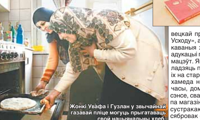
Жонкі Уафры і Гузлан у звычайнай газавай пліце могуць прыгатаваць свой нацыянальны хлеб.

ў сваёй галіне, маюць досвед працы з іншаземцамі, дапамагаюць яму наладзіць эфектыўныя навуковыя даследаччы працэсы. — Таццяна Дзмітрыеўна — выдатны вучоны, уважлівы педагог, чулы чалавек, у той жа час патрабавальны і строгі кіраўнік.