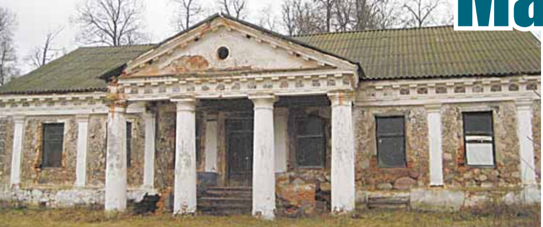
Ад колішняй сядзібы засталася напаярабурэнны флігелі.