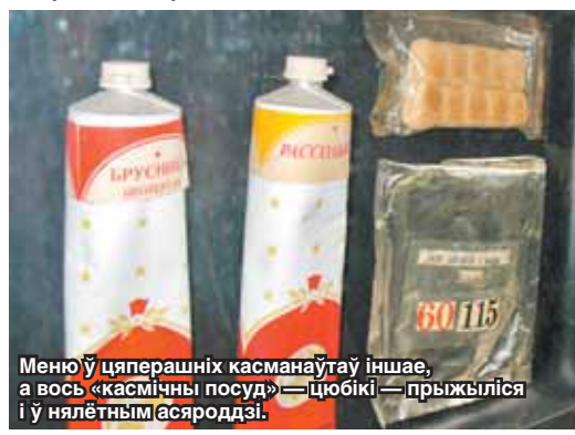
Меню ў цяперашніх касманаўтаў іншае, а вось «касмичны посуд» — цюбікі — прыжыліся і ў нялётным асяроддзі.

ў нас не адбылося», — усміхаецца генерал-палкоўнік авіяцыі.