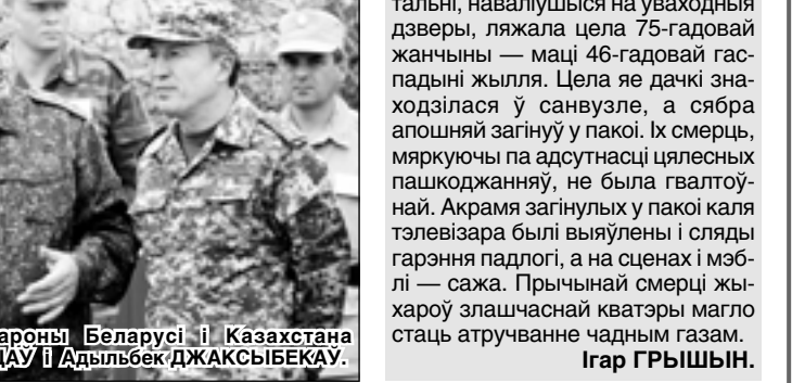
Міністры абароны Беларусі і Казахстана Леанід МІЛЬЦІЦАў І Адільбек ДЖАКСЫБЕКАў.

АСВ «Захад-2009» таксама прадугледжвае дзеянні Узброеных Сілаў Беларусі на тэрыторыі Расіі (палігоны Ашулук, Тэлемба).