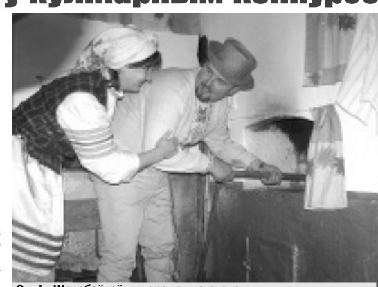
Сям'я Шарабайкаў — пераможца этапа.

«...А чаму ўласна ля печы павінна абавязкова быць гаспадыня? А гаспадар чым горшы, я, напрыклад? Я сваю печ, каб вы ведалі, спецыяльна для такога выпадку загадзя адрамантаваў, пафарбаваў. А вы кажаце — гаспадыня! Няхай у маю хату таксама прыходзіць!». Так або прыкладна так даводзіў арганізатар чарговага этапу «Уладар печы» сямейнага сельскагаспадарчага праекта «Уладар вёскі», што праходзіць у Глыбоцкім раёне, адзін дзядуля. Справа ў тым, што для правядзення кулінарнага конкурсу трэба было загадзя адшукаць і дамовіцца з гаспадынямі дзясці рускіх печу нахонт іх (і печу, і гаспадыню) удзелу ў гэтым этапе гульні. З гэтай мэтай старшыні сельскагаспадарчага прадпрыемства і сельскага Савета ў пошук патрэбна аб'ехалі ўсё наваколле. У выніку не адмовіў ніхто з «печуладальнікаў», у ліку якіх былі і два мужчыны (дзядуля дабіўся-такі свайго!).