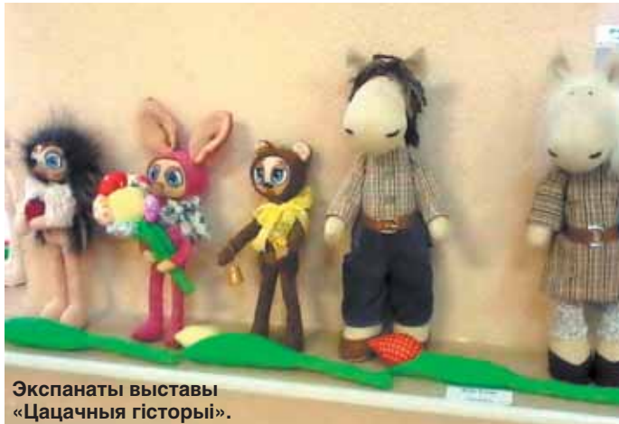
Экспанаты выставы «Цацачных гісторыі».